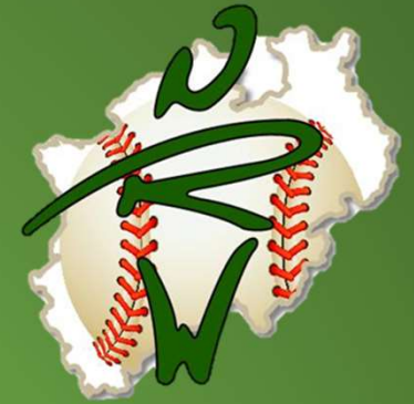
Stellenportal für Freiwilligendienste im Sport in NRW